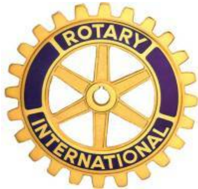
Rotary Club International Rotary Club Nuova Iguaçu - Brasile